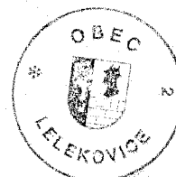
Diviš Jaroslav starosta obce

Realizace 1. patra nad stávající prodejnu, která bude obsahovat ordinaci zubního a dětského lékaře, výdejnu léků a klubovny pro spolky a setkávání občanů, včetně potřebného zázemí jednotlivých prostor. Předpokládaná cena 10,5 mil Kč, v 1.čtvrtletí předpokládáme podání žádosti o stavební povolení, cca 2.čtvrtletí 2016 výběrové řízení na dodavatele stavby, zahájení prací 2.pololetí 2016.