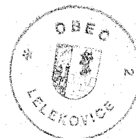
Diviš Jaroslav starosta obce

Současně Vás informujeme, že po vydání územního plánu je dle stavebního zákona opatření obecné povahy zveřejněno veřejnou vyhláškou na úřední desce pořizovatele a obce, pro kterou je územní plán pořizován. Opatření obecné povahy je doručováno veřejnou vyhláškou a současně je zveřejňován vydaný územní plán v kompletní podobě, včetně rozhodnutí o námítkách a vypořádání připomínek.