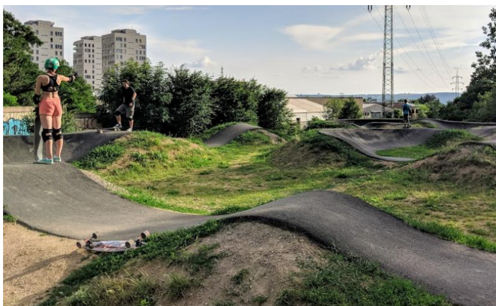
Asfaltový Pumtrack v Brně na sídlišti Lesná, Dusíkova ulice

Předkládaný záměr je jednodušší varianta pumtracku s nezpevněným povrchem, který má své nevýhody v tom, že časem dochází k jeho deformaci a jsou později nutné opravy. Další nevýhodou je, že jízda po dešti není příliš komfortní a je třeba počkat, až dráha vyschne. Jako řešení se jeví zpevnění povrchu vyasfaltovat. Takovýto pumtrack je například v Brně na Lesné, který má výrazně rozšířenou možnost užívání. Asfaltový povrch je vhodné aplikovat až po roce užívání, neboť se celá trať usadí a stabilizuje se její tvar. To by mohl být další návrh na vylepšení života v obci v rámci "participativní části rozpočtu" v příštím roce.