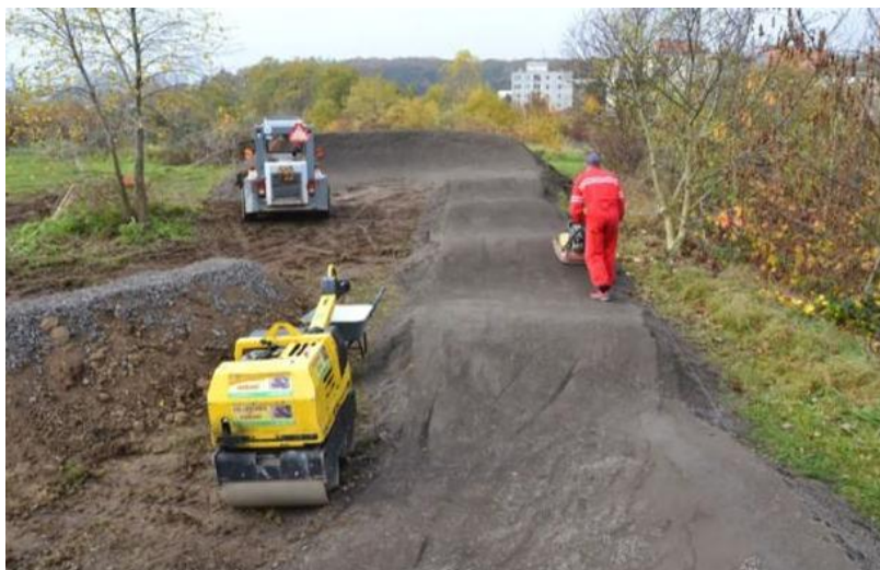
Stavba pumtracku - hutnění povrchové vrstvy

Samotná stavba zabere přibližně jeden týden. Při stavbě je nutné nejprve navozit hlínu a následně jí dát požadovaný tvar. Po nasypání základního tvaru je nutné klopené zatáčky částečně ztuhnout, ideální je ujezdit vnitřní rádius nakladačem a následně použít vibrační desku (žábu). Při hutnění hlína sesedne o cca 30 %, proto je nutné mít dostatečné množství hlíny. Hutnění je pak třeba provést i při pokládce každé další vrstvy jak hlíny, tak i povrchové vrstvy. Po hutnění je třeba hráběmi a lopatami dráhu precizně vytvarovat a ještě přeskákat vibrační deskou.