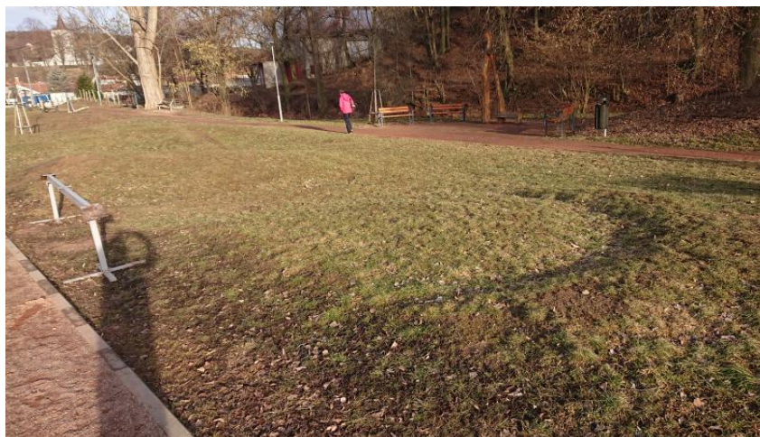
Prostor pro realizaci Pumtracku

Pumtrack bude umístěn na dětském hřišti u hasičky v prostoru, který je ohraničen cvičnou plochou hasičů, dětskými prolézačkami, chodníkem podél Ponávky a stroji pro fitness cvičení. V tomto prostoru již dříve bývala vyježděná dráha pro kola s terénními nerovnostmi, která byla po rekonstrukci celého prostoru dětského hřiště u hasičky částečně zmenšena. V současné době je zde vyježděná stopa, ale terénní nerovnosti jsou velmi malé, zatáčky nízké a málo klopené a jízda nepřináší velkou radost.