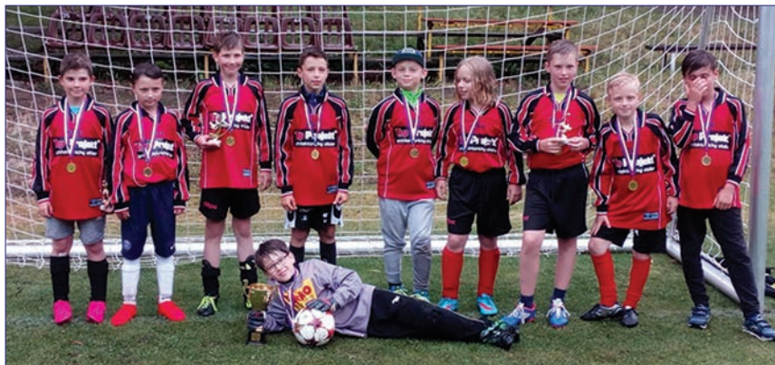
Starší přípravka AC Lelekovice 2016-17 – vítěz městského přeboru skupiny D